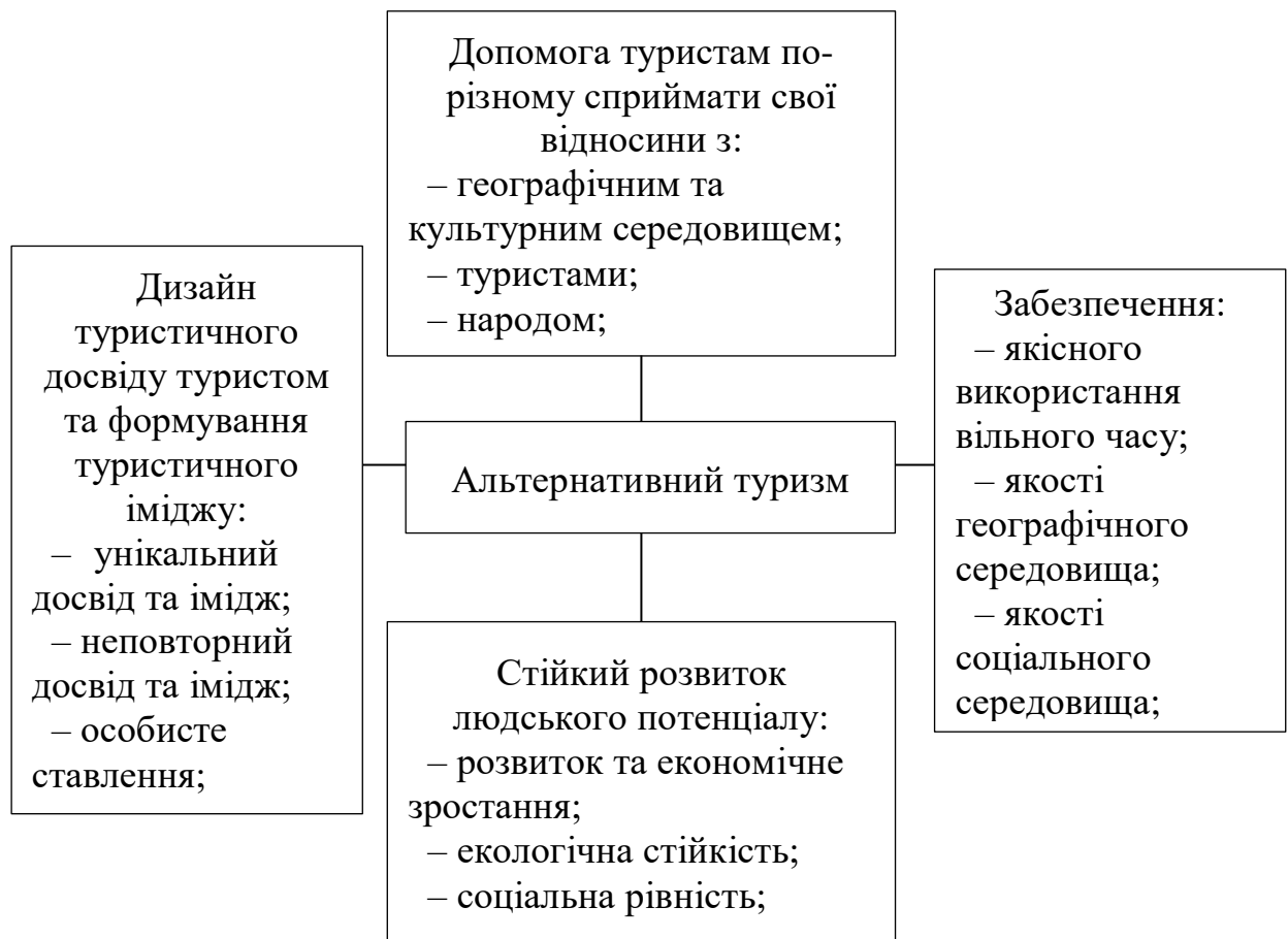
Рис. 1.2 – Модель альтернативного туризму

Таким чином, альтернативний туризм вимагає розробки довгострокового плану та державної політики, що спираються на