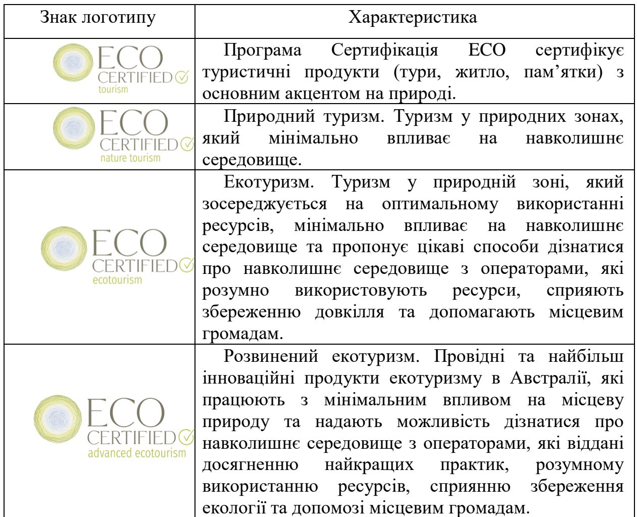
Таблиця 3.1 – Характеристика програм сертифікацій ЕСО з логотипами

Прагнення компаній разом із Travalyst Coalition, в якій Booking.com є партнером-засновником, полягає в тому, щоб створити універсальний і прозорий засіб для інформування про екологічну нерухомість у всій галузі (див. табл. 3.2).