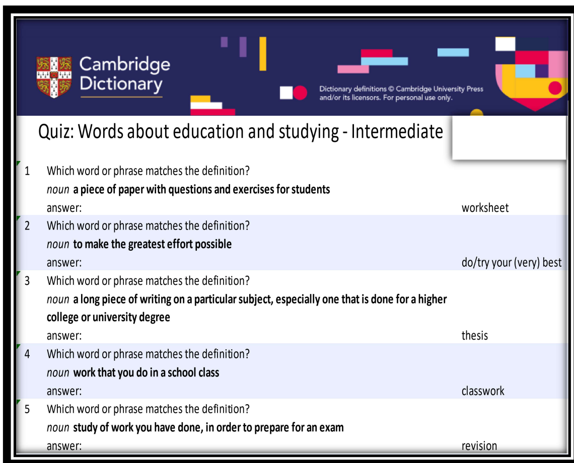
Рисунок 2. Quiz: Words about education and studying –Intermediate