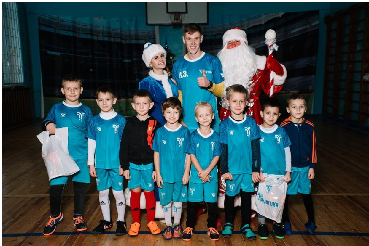
Рис. В.3. Навчально-виховний процес у футбольній школі «Талантіка»