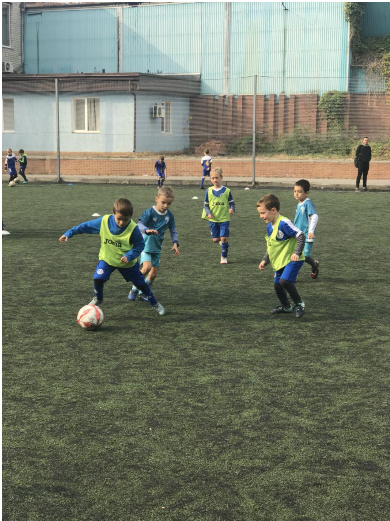
Рис. В.2. Навчально-виховний процес у футбольній школі «Талантіка»