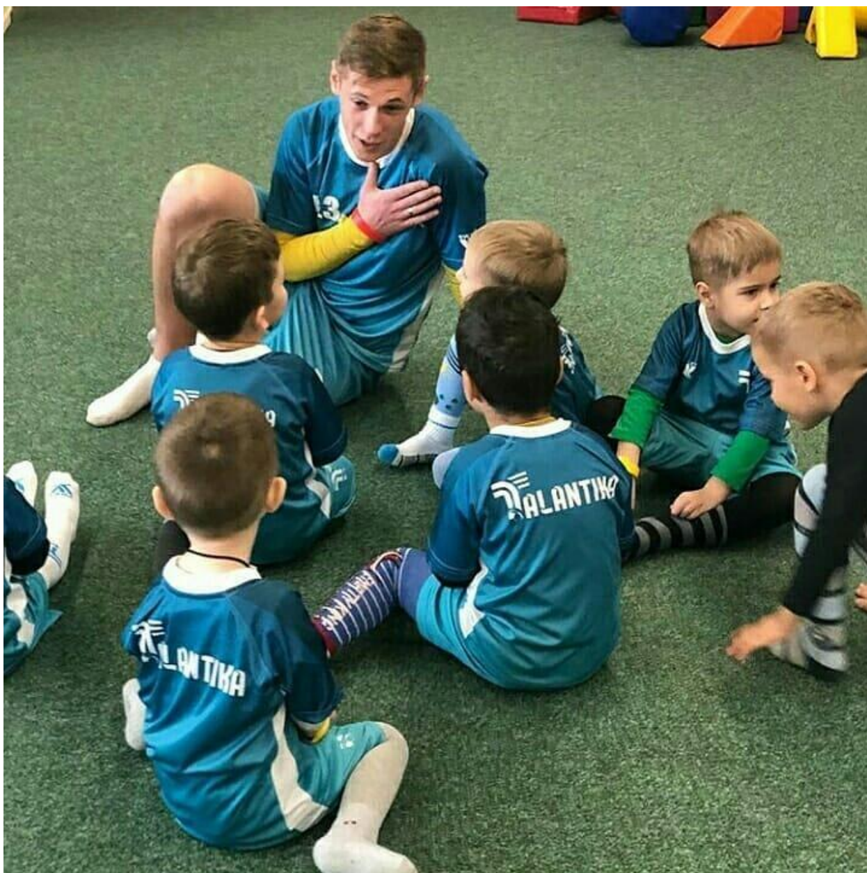
Рис. В.1. Навчально-виховний процес у футбольній школі «Талантика»