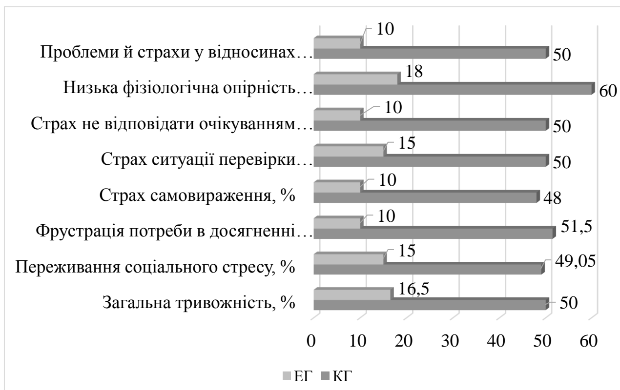
Рис. 3.4. Результати перевірки психо-емоційного стану хлопців 5-6 років на початку експерименту

Більш показово результати діагностики тривожності досліджуваного контингенту ми представили на рисунку 3.4.