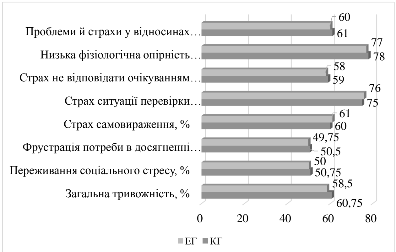
Рис. 3.2. Результати перевірки психо-емоційного стану хлопців 5-6 років на початку експерименту

Так, на рисунку 3.2., ми графічно представили показники перевірки психо-емоційного стану хлопців 5-6 років.