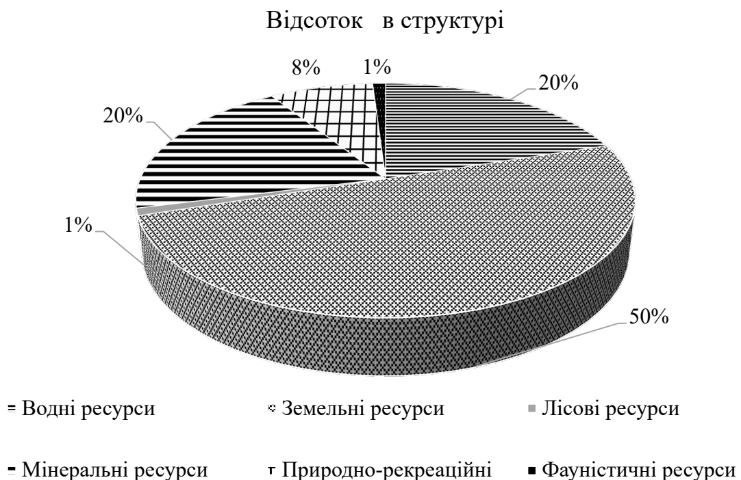
Рис. 2.1 – Компонентна структура ПРП Запорізької області

Згідно з компонентною структурою природу рекреаційного потенціалу (ПРП) Запорізької області найбільшу частину займають земельні ресурси природу рекреаційні та мінеральні ресурси.