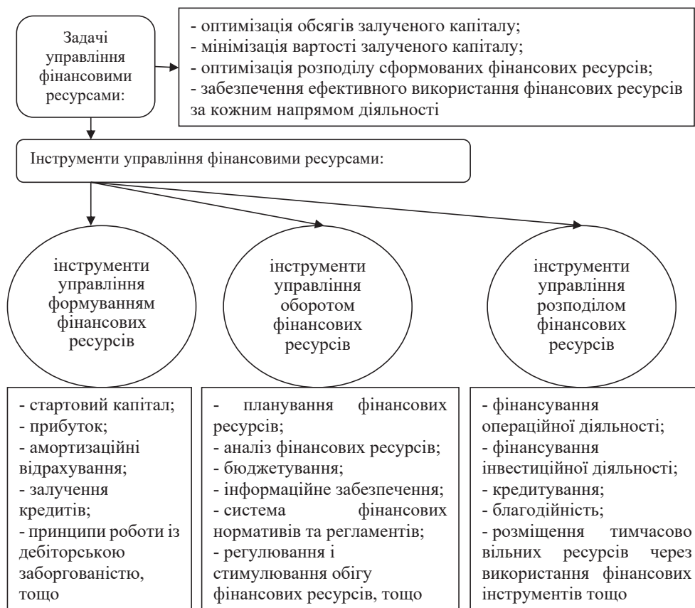
Рисунок 4 – Управління фінансовими ресурсами у розрізі груп інструментів (узагальнено авторами на базі