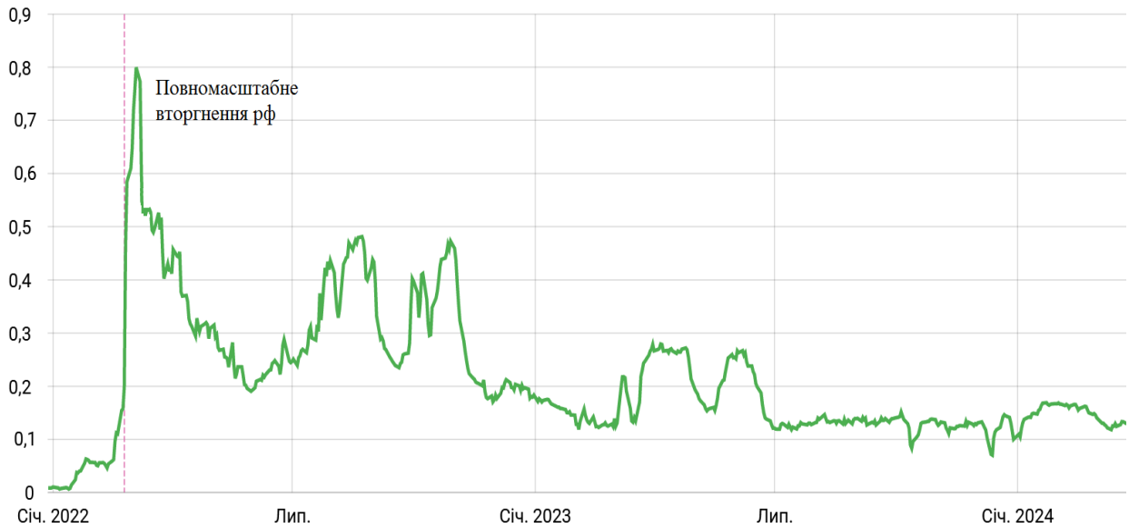
Рисунок 2 – Індекс фінансового стресу з початку повномасштабного вторгнення