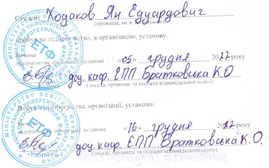
Рисунок 4.1 – Місця для печаток від підприємства, організації, установи з приводу прибуття та відбуття студента з місця практики

Щоденник практики ведеться та заповнюється студентом особисто. По закінченню періоду практики у щоденнику повинно міститись три мокрі печатки (штампи) від підприємства, а саме: прибув та вибув з місця проходження практики; після відгуку і оцінки роботи студента на практиці від підприємства, установи, організації. Приклади заповнення та місця печаток показані на рисунку 4.1 та 4.2