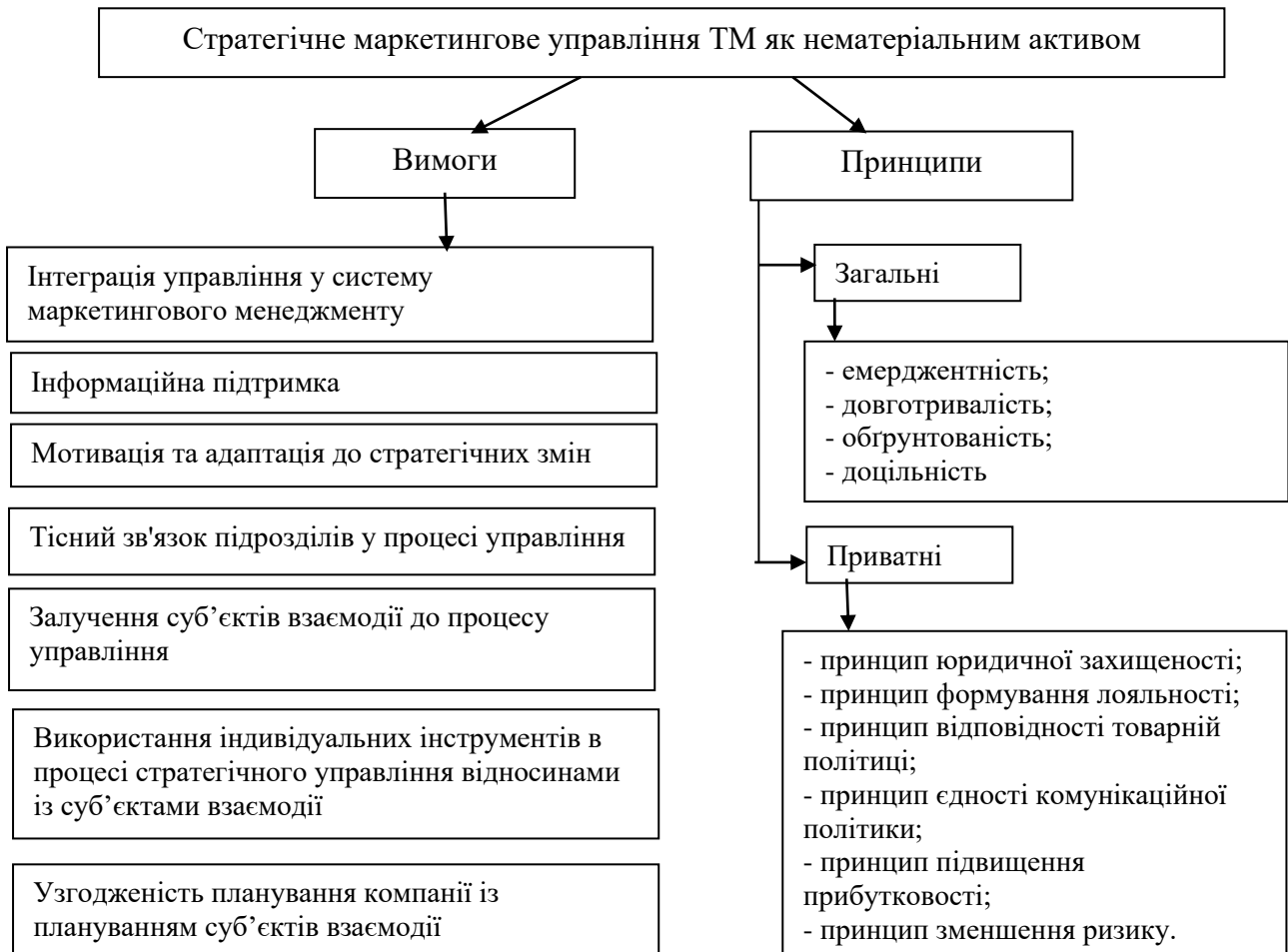
Рис. 2. Вимоги та принципи стратегічного маркетингового управління торговельною маркою як нематеріальним активом

Управління торговельною маркою як нематеріальним активом має бути зосереджене на вищих рівнях організаційної структури й поширюватися на всю компанію. Для того, щоб бути ефективним, воно має будуватись певних вимогах та принципах, які наведено на рисунку 2.