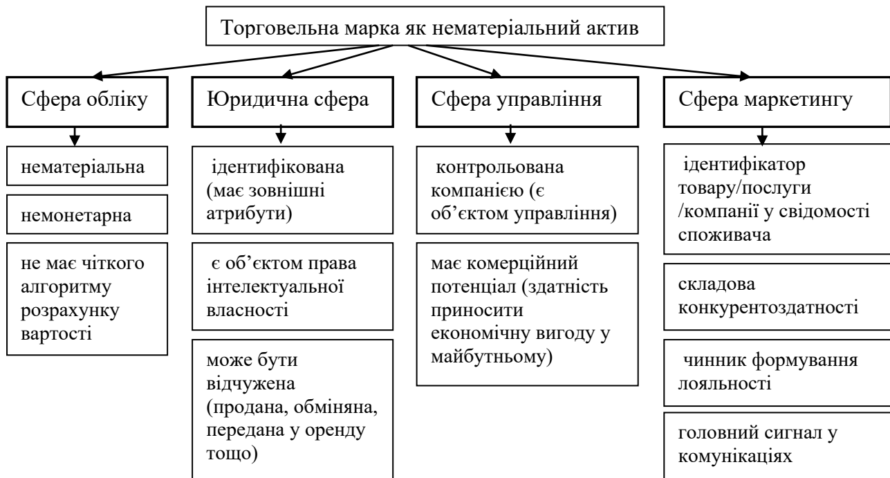
Рис.1. Характеристики торговельної марки як нематеріального активу