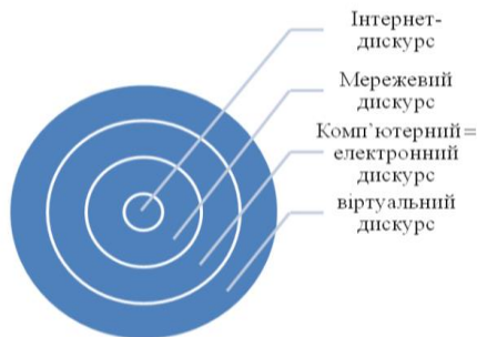
Рисунок 8.1 – Система дискурсу Інтернет-комунікації

Окрім того, комп'ютерному дискурсу притаманний безпосередній контакт комунікантів, чого немає при віртуальному спілкуванні, де партнер по комунікації багато в чому домислюється нашою свідомістю. А з іншого боку, віртуальний дискурс трактується ширше, ніж комп'ютерний, оскільки спілкування у віртуальній реальності створюється не лише через комп'ютер, але й інші засоби зв'язку [Лутовинова 2009, с. 9]. Разом з тим, електронний (комп'ютерний) та віртуальний дискурси позначають масиви, котрі окрім текстів Інтернет-середовища включають тексти на непаперових носіях (аудіокниги, фільми, музичні диски, ігри, програми), мультимедійні прилади (смартфони, комунікатори, ipods, ebooks) тощо та є значно ширшими, ніж Інтернет-дискурс [Назарова 2010, с. 129]. З огляду на неоднозначність відношень між вищезазначеними видами дискурсів Інтернет-комунікації, вважаємо доцільним зобразити їх таким чином: