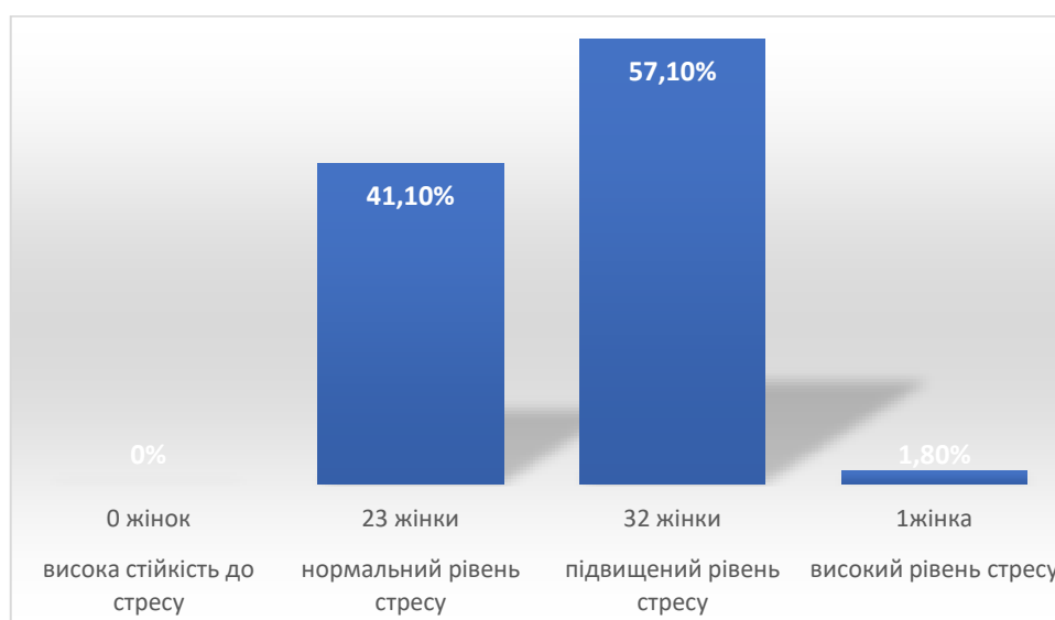
Рис.2.3. Рівень стресостійкості за результатами методики «Бостонський тест», у %

Разом із тим майже 41,10% жінок зберігають нормальний рівень стресостійкості, що вказує на здатність частини вибірки мобілізувати внутрішні та зовнішні ресурси для підтримання психологічного балансу. Це підкреслює необхідність розвитку та зміцнення індивідуальних копінг-стратегій, а також важливість доступу до соціальної, психологічної та інформаційної підтримки.