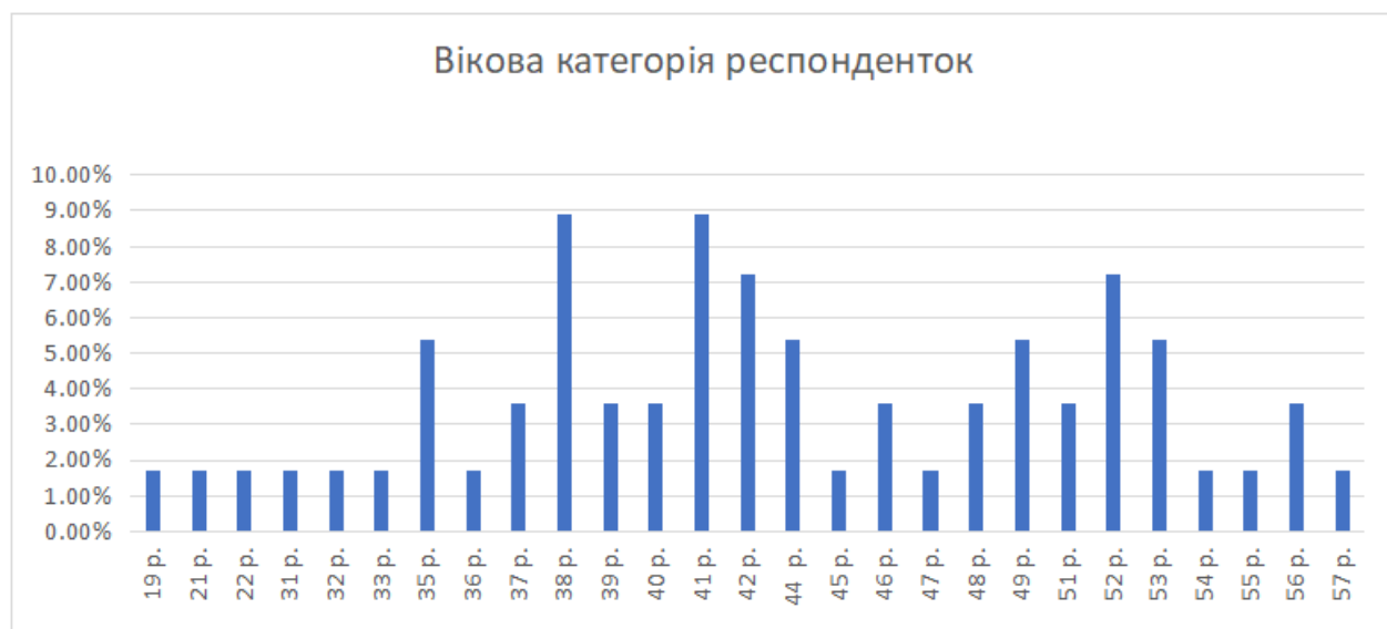
Рис. 2.1. Розподіл учасниць емпіричного дослідження за віком, у %

У дослідженні взяли участь українські жінки віком від 18 до 60 років (рис. 2.1.), загальна кількість учасниць: 56 осіб, що забезпечує достатню репрезентативність та можливість проведення статистичного аналізу.