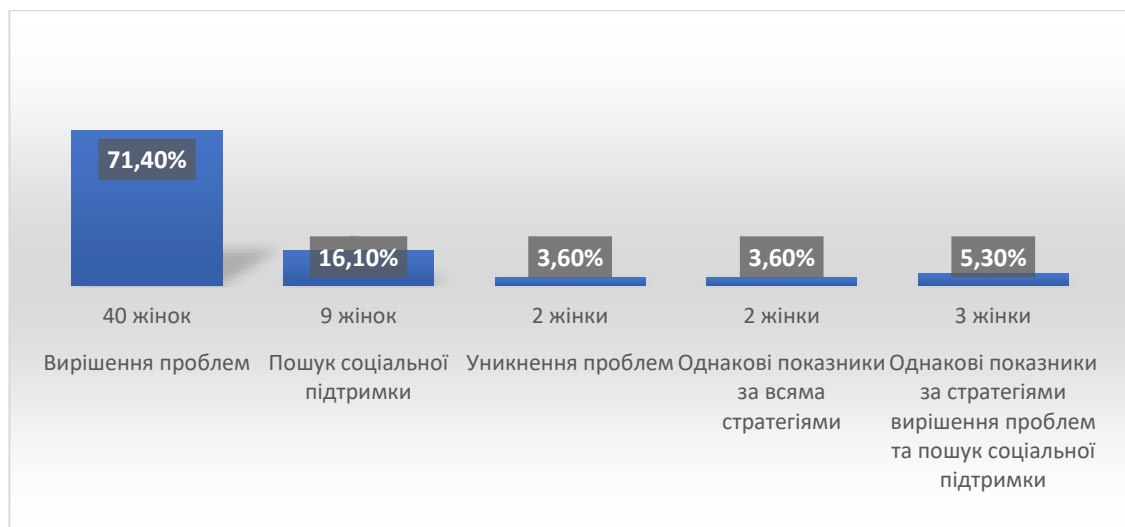
Рис.2.6. Загальні показники копінг-стратегій за методикою «Індикатор копінг-стратегій» (Coping Strategy Indicator, за Д. Амірханом), у %

Загальні показники у процентному співвідношенні виглядають наступним чином (рис.2.6.).