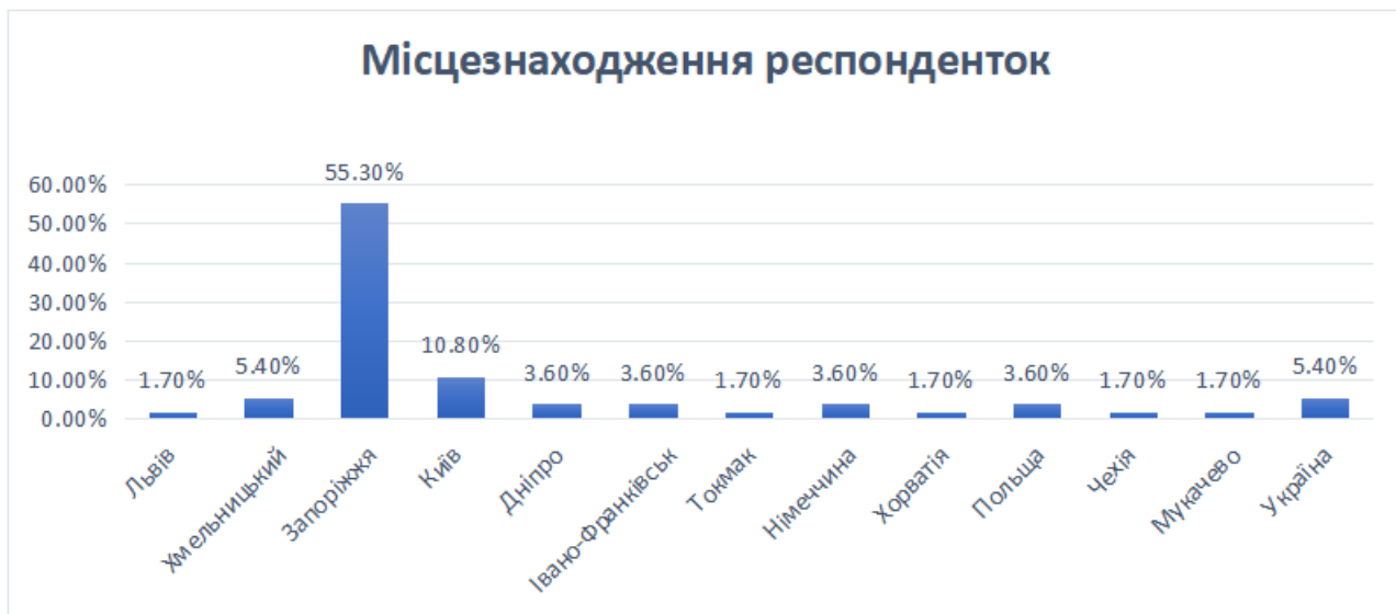
Рис.2.2. Місцезнаходження учасниць емпіричного дослідження, у %

Серед учасниць дослідження були українські жінки з різних міст України та Європи (рис.2.2).