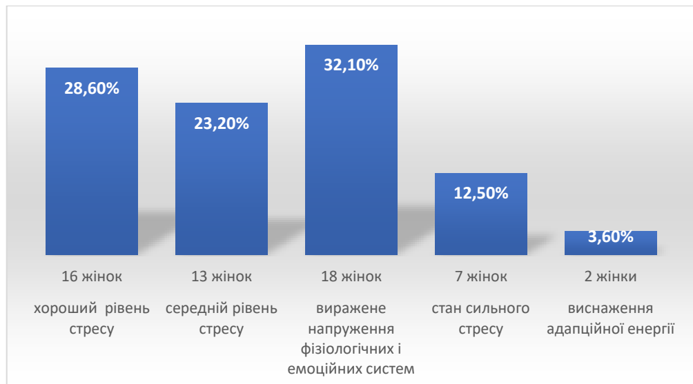
Рис.2.4. Показники рівня стресу за тестом В.Ю. Щербатих, у %

Окрім визначення загального рівня стресу, «Тест на визначення рівня стресу» (за Ю.В. Щербатих) дозволяє ідентифікувати тип стресових проявів (рис.2.5.). Результати показують, що для частини жінок стрес проявляється в певному домінуючому напрямі: