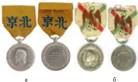
а – Médaille commémorative de l'expédition de Chine;

Так, у медалі за Другу опіумну війну в Китаї (рисунок 1, а), заснованої декретом імператора Наполеона III в 1861 р., головним фактором для розрізнення є ім'я медальєра, клейма і тип вушка медалі. Офіційні медалі виробництва паризького монетного двору (фр. Monnaie de Paris) виготовлені зі срібла, підписані ім'ям скульптора Альберта Барре – «BARRE», з великим округлим вушком, клеймами «голова орла» на вушку і «якір» на реверсі є артефактами своєї епохи. Медалі, підписані «SACRISTAIN F.», «E.FALOT», «E.F.», або зовсім без імені медальєра, а також медалі із вушком типу «маленька куля», – виготовлені приватно, і часто значно пізніше. Вони можуть супроводжуватися клеймами срібла: «голова кабана» (1870-і – 1960-і роки), «краб» (1960-і – 1980-і роки) (див. рис. 2), а також клеймами виробника.