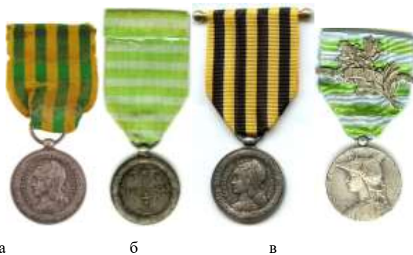
а – Médaille commémorative de l'expédition du Tonkin; б – Médaille commémorative de Madagascar (1886 р., реверс); в – Médaille commémorative de l'expédition du Dahomey; г – Médaille commémorative de Madagascar (1896 р.) з пізнім кулястим вушком