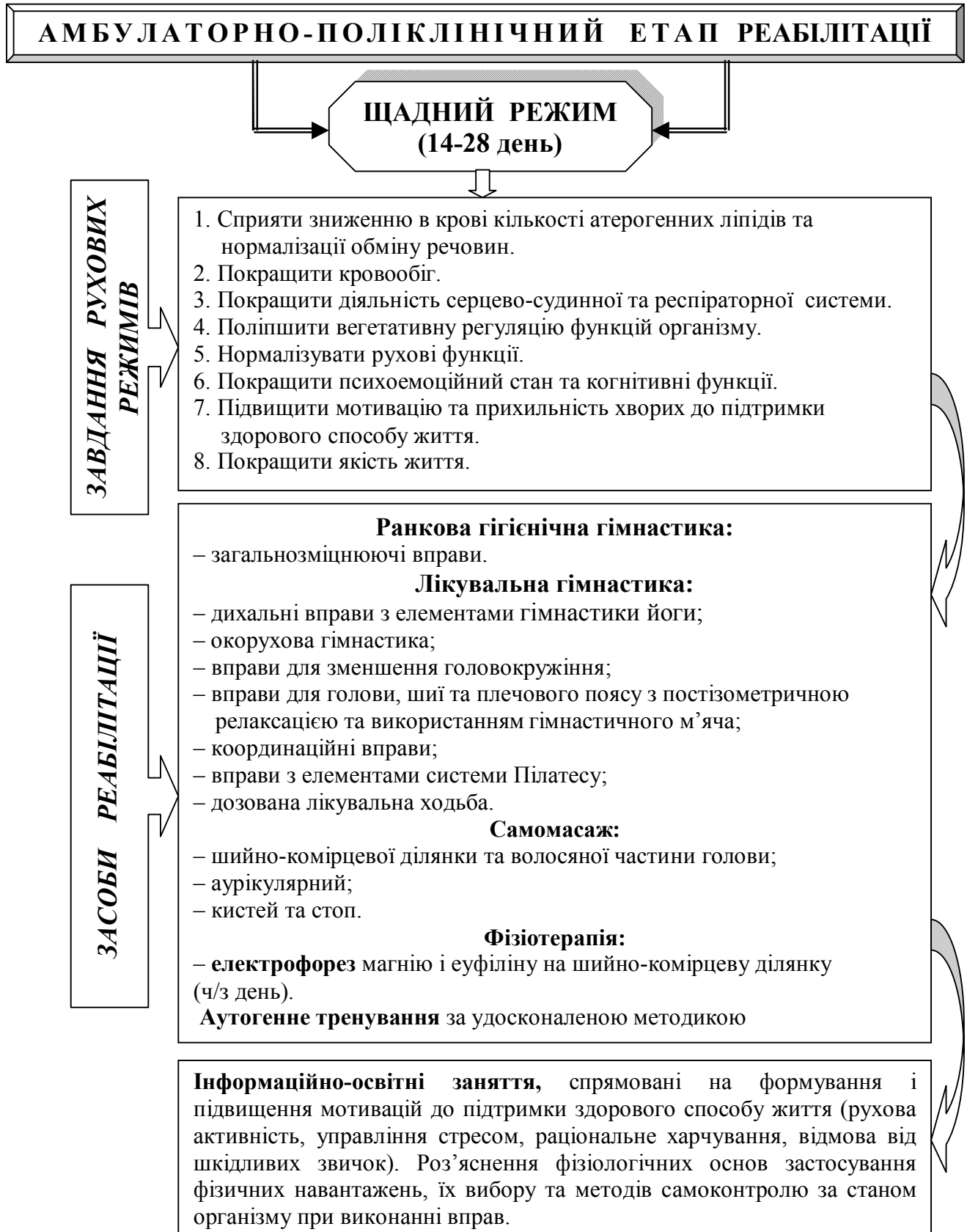
Рис. 2. Блок-схема комплексної програми фізичної реабілітації жінок з атеросклеротичною хронічною ішемією мозку на амбулаторно-поліклінічному етапі