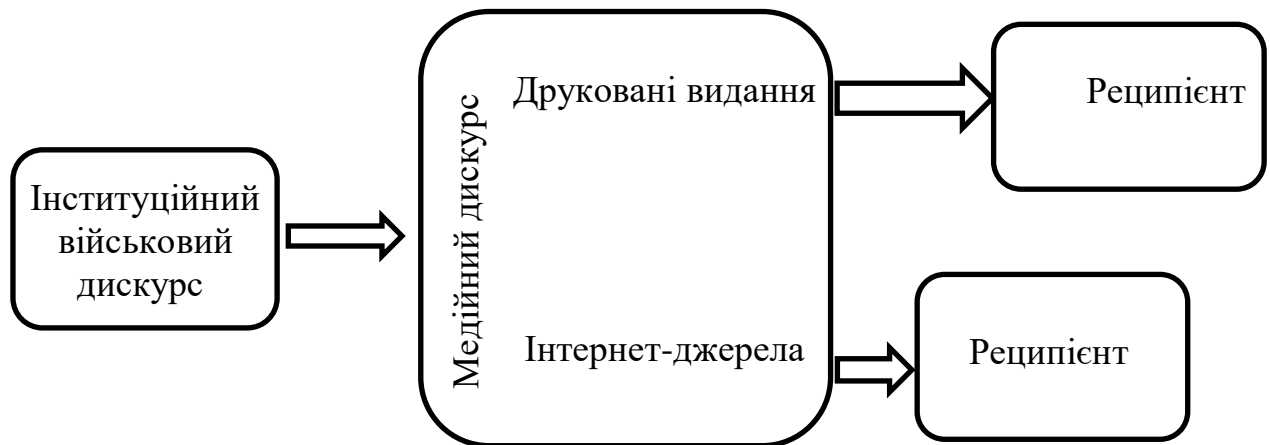
Рис 3.1. Проходження інформації

використання Інтернету. Цей сильний технічний поштовх спричинив величезний потік інформації, що передається по всьому світу. Зв'язок військового дискурсу з медійним дозволяє нам говорити про передачу інформації військової тематики з медіа-каналів. Для нашого аналізу ми виділяємо два основні медіа-канали – це друковані видання та Інтернет джерела. Проходження інформації нами було представлено на Рис. 3.1: