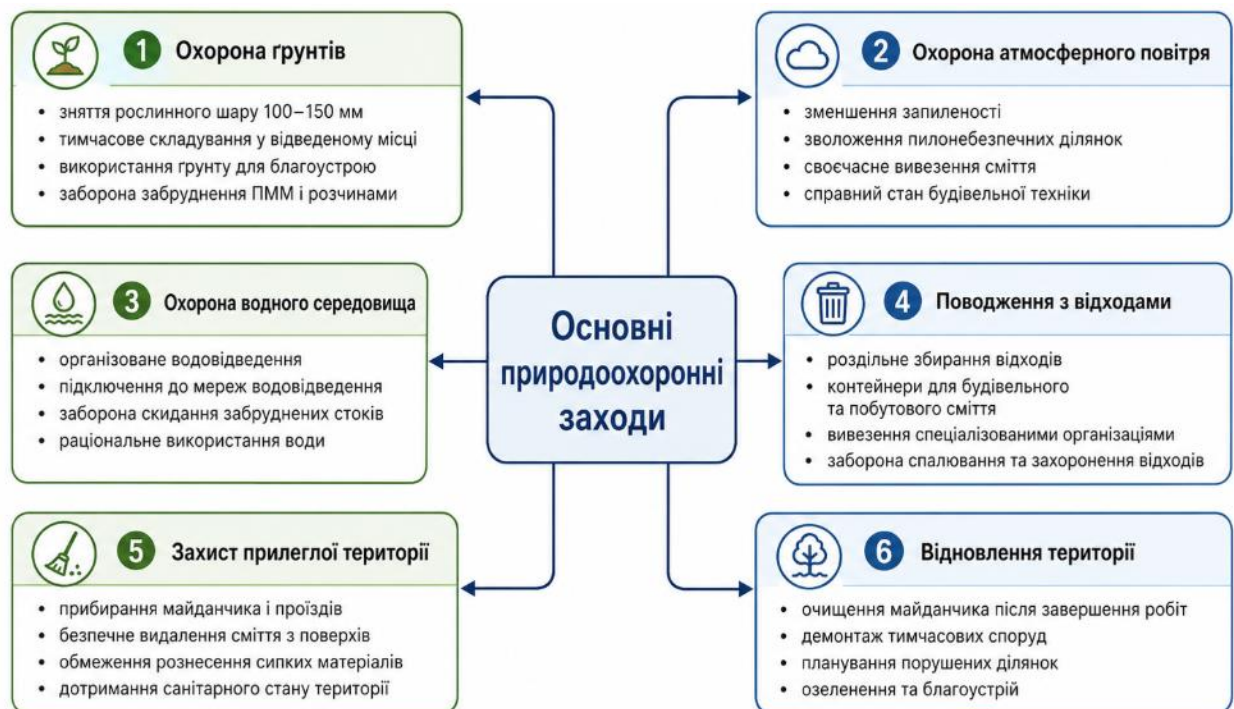
Рисунок 5.3 – Заходи з охорони навколишнього середовища

Під час розроблення проєктних рішень необхідно враховувати вплив будівництва на прилеглу територію, інженерні мережі, умови поверхневого водовідведення та санітарний стан будівельного майданчика. Організація робіт повинна передбачати мінімальне порушення природного стану ділянки, раціональне використання ресурсів і недопущення забруднення території.