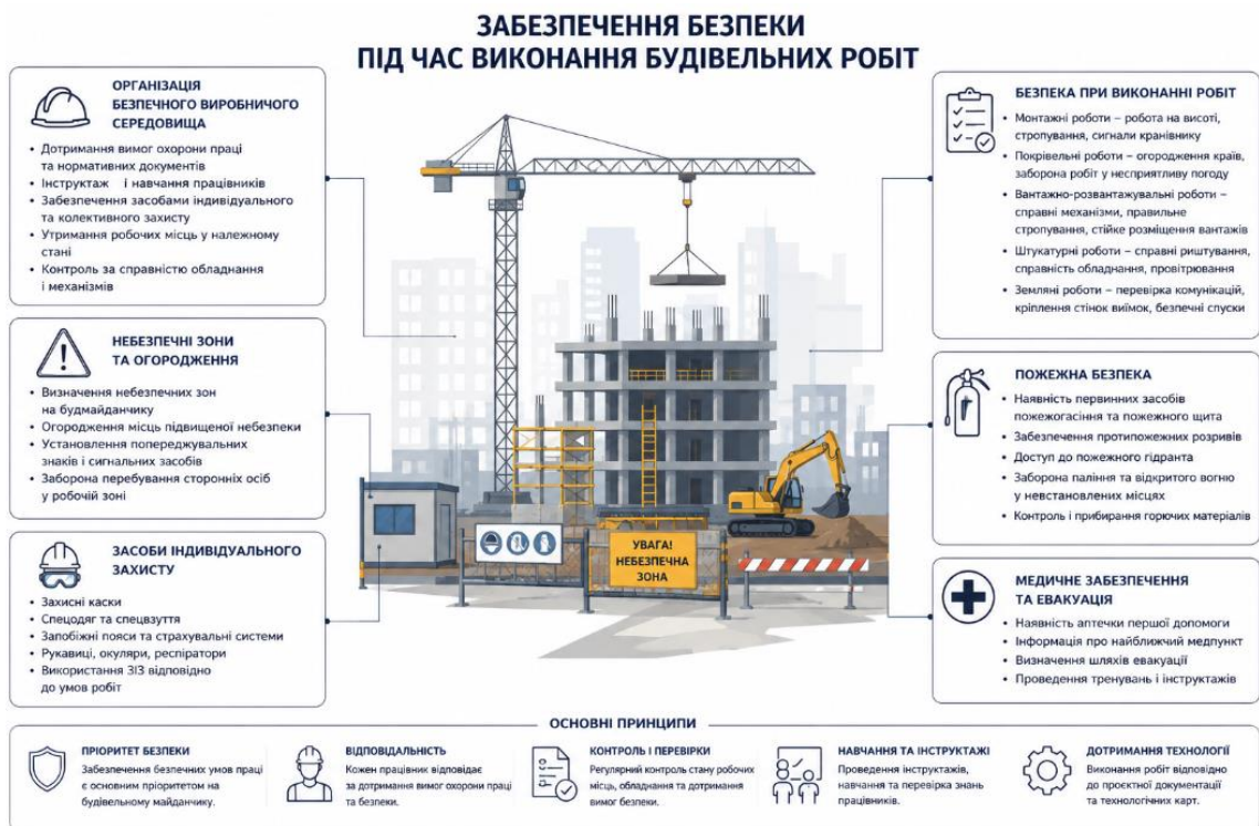
Рисунок 5.2 – Безпека праці при виконанні основних видів робіт

Вантажопідіймальні машини, вантажозахоплювальні пристрої, стропи, траверси, контейнери та засоби пакетування повинні бути справними та відповідати вимогам безпечної експлуатації.