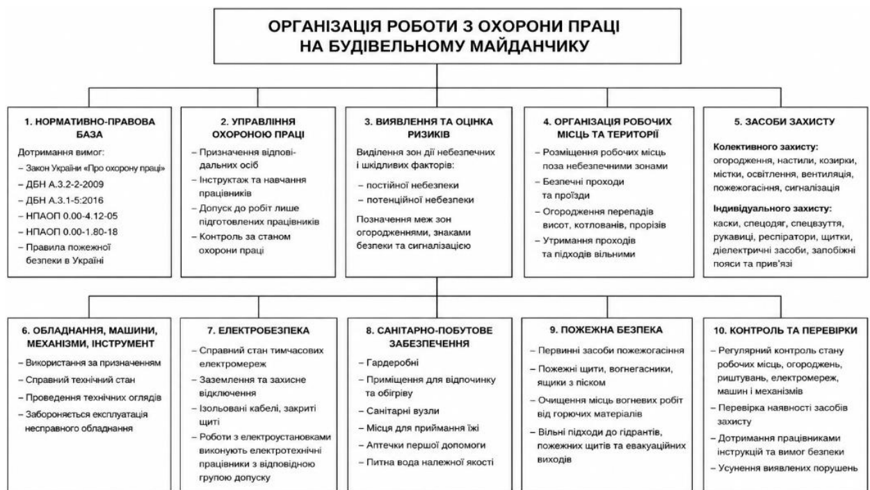
Рисунок 5.1 – Загальні засади з організації безпеки праці

Працівники забезпечуються засобами індивідуального захисту відповідно до характеру виконуваних робіт. На будівельному майданчику обов'язковим є використання захисних касок, спецодягу, спецвзуття та рукавиць. Під час робіт із пиловиділенням застосовуються респіратори, під час зварювання – захисні щитки або маски, під час роботи з електроінструментом – діелектричні засоби захисту, під час робіт на висоті – запобіжні пояси або страхувальні прив'язі.