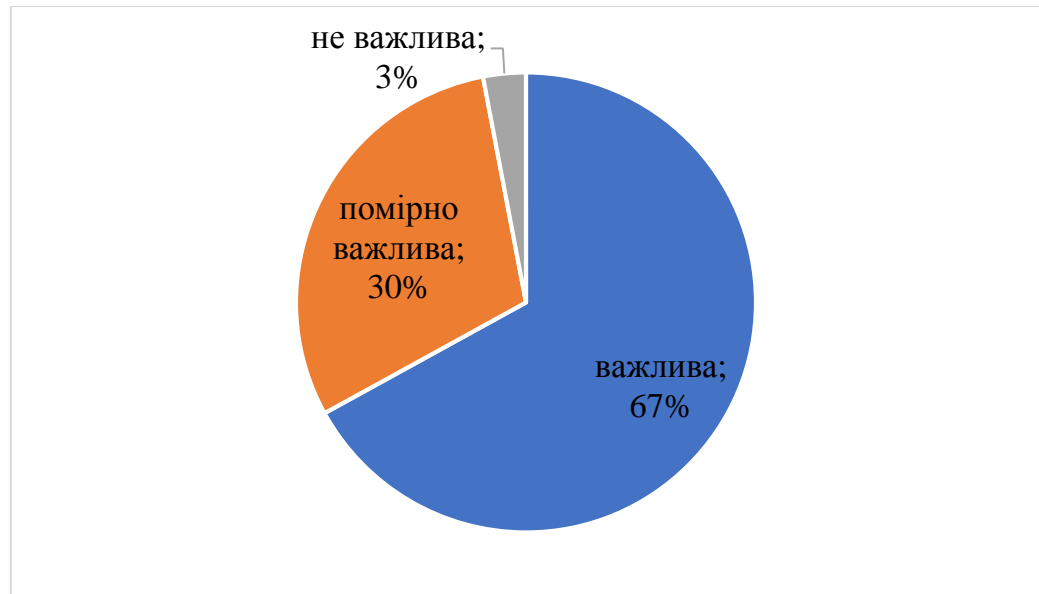
Рис. 2.1. Важливість родини для засуджених

Результати дослідження свідчать, що 53 % засуджених мають позитивні емоції у стосунках із родиною (любов, вдячність), тоді як 47 % демонструють негативні переживання (вина, образа, байдужість). Такий розподіл відображає глибокі внутрішні суперечності, соціальний досвід і психологічний стан засуджених, що виникають унаслідок порушених або трансформованих сімейних стосунків (рис. 2.2).