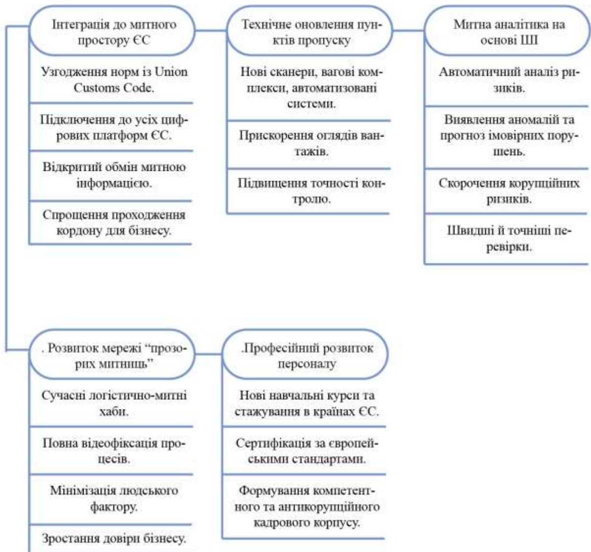
Рисунок 2.1– Стратегічні напрями розвитку митної системи України

Для подолання цих проблем визначено стратегічні напрями розвитку (рис. 2.1).