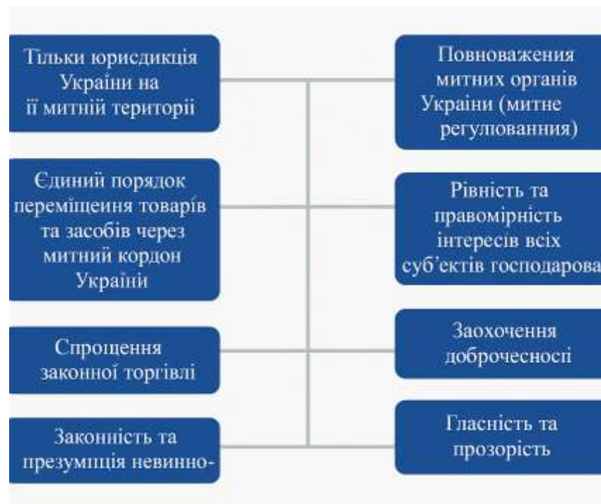
Рисунок. 1.1 - Основні принципи організації митних процедур в Україні

Усі ці принципи зображено у вигляді схеми (рис. 1.1), що підкреслює їх взаємозв'язок і системність у побудові сучасної митної політики.