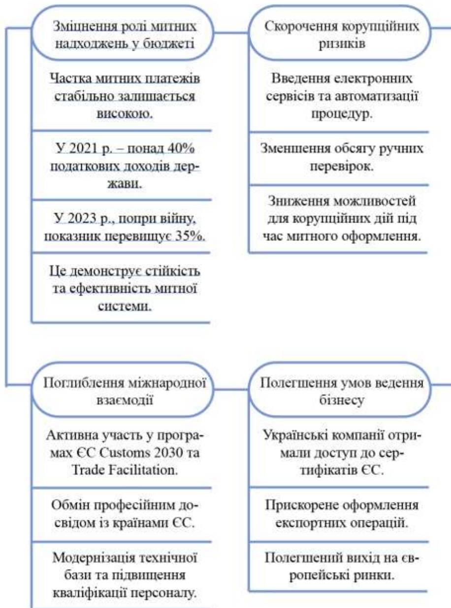
Рисунок 2.2 – Позитивні результати діяльності митних органів України у сучасних умовах

Не менш вагомим є питання професійної підготовки кадрів. У партнерстві з Європейським Союзом продовжується розробка навчальних програм, спрямованих на підвищення кваліфікації митників у сфері цифрових технологій, ризик-менеджменту та протидії шахрайству. Зміцнення аналітичної складової діяльності митних органів також виступає ключовим завданням.