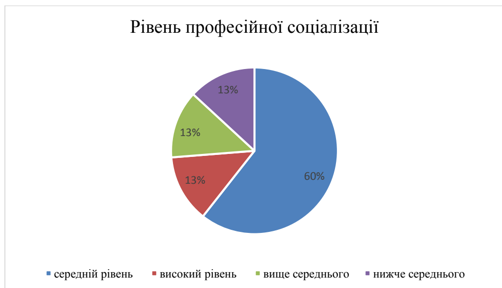
Рис. 2.1. Оцінка рівня професійної соціалізації в умовах дистанційного навчання під час військового стану

Не менш важливим є розуміння того, як самі студенти оцінюють свій рівень професійної соціалізації, дозволить визначити ефективність наявних механізмів та обґрунтувати необхідність впровадження нових форм підтримки. На питання «Як Ви оцінюєте свій рівень професійної соціалізації (формування професійної ідентичності, засвоєння професійних норм і цінностей) в умовах дистанційного навчання під час військового стану?» студенти-респонденти надали наступні відповіді. Ми отримали наступні результати, що зображені на рисунку 2.1.