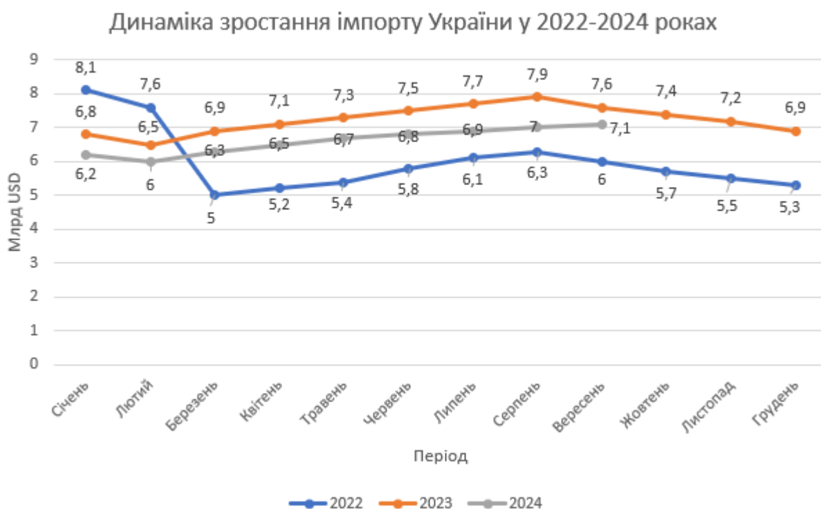
Рисунок 2.3 – Динаміка зростання імпорту України у 2022-2024 роках

інфраструктури, а також загрози безпеці логістичних маршрутів призвели до різкого скорочення обсягів імпорту.