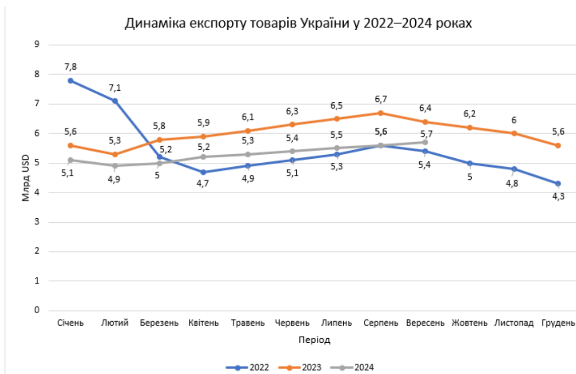
Рисунок 2.2 – Динаміка експорту товарів України у 2022–2024 роках

припиненням виробництва на окупованих територіях. Протягом другого кварталу 2022 року експорт залишався на критично низькому рівні — від 4,7 до 5,1 млрд доларів США щомісяця, що свідчить про системну дестабілізацію зовнішньоекономічної діяльності.