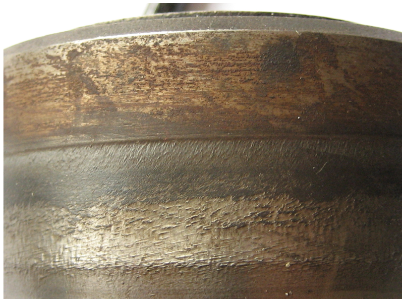
Рисунок 4 – Износ рабочей части вала из стали ДИ-22

запасом пластичности и меньшей микропористости по сравнению с металлами открытой выплавки. Опытный валок по своей износостойкости превосходит стандартный в 3 раза. При этом расход металла сократили на 50%.