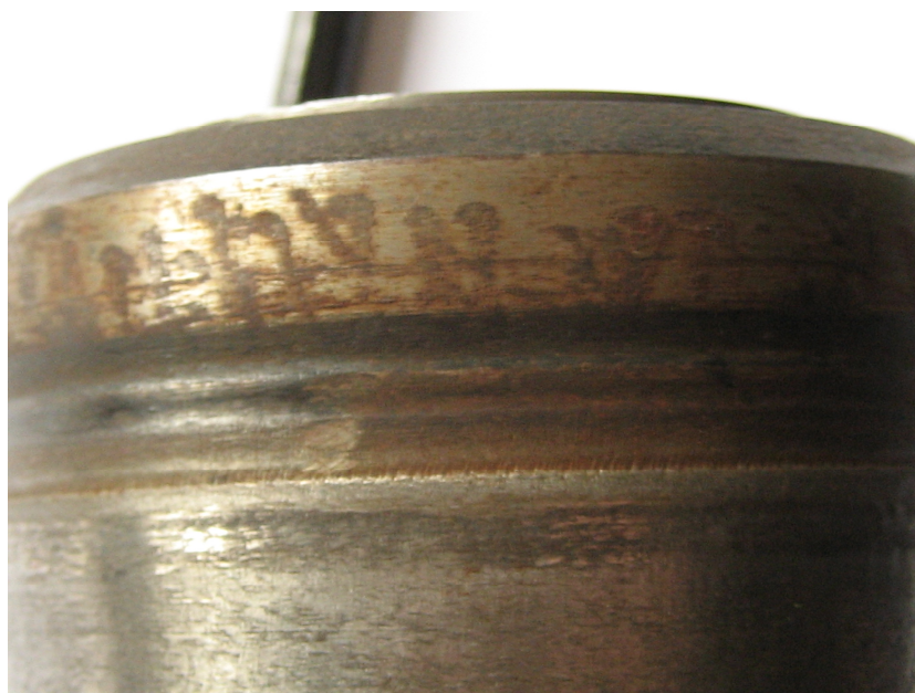
Рисунок 3 – Износ рабочей части вала из стали У7

Известно, что наименьшее сопротивление износу имеет валок, изготовленный из стали У7: за 40 рабочих часов валок до износа прокатал 10 т металла. Рассмотренные валки из стали ДИ-22 и Ди-23 показали, что сопротивление износу повысилось в два раза, а сопротивление износу валка из стали Р6М5 – в три раза.