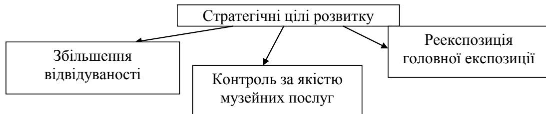
Рис. 1. Розстановка стратегічних цілей Національного музею історії України у Другій світовій війні

Сьогодні за розмірами та значенням колекцій музей разом з меморіальним комплексом є