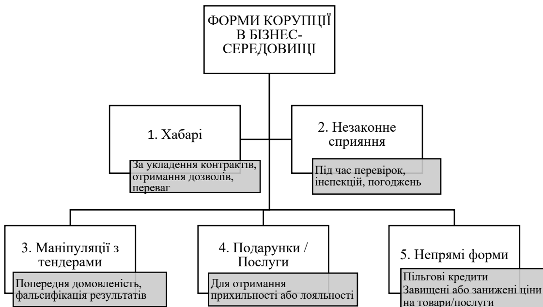
Рисунок 1.1 – Форми корупції в бізнес-середовищі [5]

Особливої уваги в межах нашого дослідження потребує теоретична модель «принципал-агент», оскільки вона найбільш точно описує управлінську структуру комунального сектора та механіку виникнення корупційних ризиків при делегуванні повноважень. У межах цієї моделі корупція трактується як економічний наслідок порушення відносин між суб'єктами діяльності, де принципалом виступає держава або орган місцевого самоврядування, а агентом – посадова особа комунального підприємства. Оскільки інтереси сторін часто не збігаються, ключовою передумовою для опортуністичної поведінки стає інформаційна асиметрія. Агент володіє значно більшим обсягом інформації щодо реального стану справ, ніж принципал, що ускладнює ефективний контроль за його діяльністю та створює умови для зловживання делегованою владою, прийняття корупційних рішень або отримання неправомірної вигоди [6].