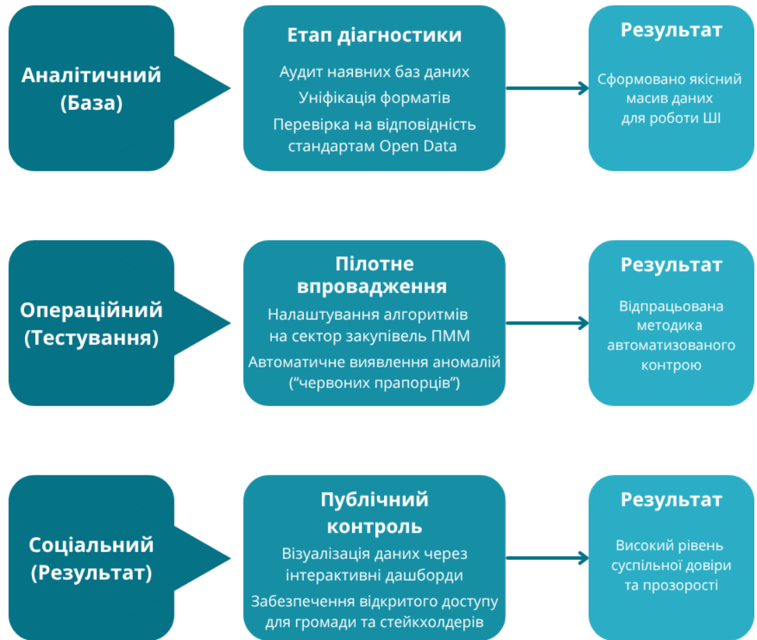
Рисунок 3.1. – Етапність імплементації міжнародних стандартів цифрового контролю на КП «Запоріжелектротранс» (розроблено автором на основі [4, 31])

тимчасової експертної робочої групи, до складу якої залучаються фахівці сектору інформаційних технологій КП «Запоріжелектротранс» та зовнішні