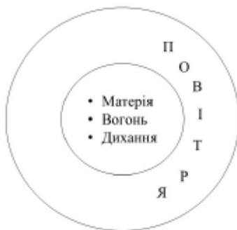
Рисунок 4. Тракткування проблематики архе Анаксименом

Незважаючи на відмінності у виборі архе, ці три філософи мають спільні основоположні риси, характерні для ранньої античної філософії: