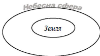
Рисунок 2. Трактуювання проблематики архе Фалесом