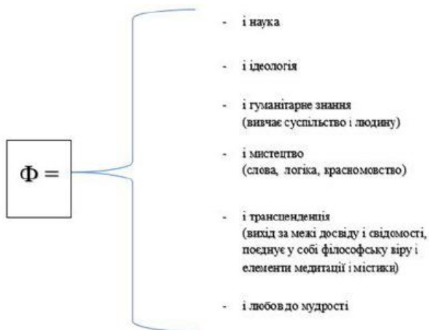
Рисунок 1. Філософія як комплексний інтегрований вид знання

Отже, у потрібний час, у потрібну годину на заміну міфологічному історичному типу світогляду прийшов філософський світогляд, як комплексний інтегрований вид знання: і наука, і ідеологія, і гуманітарне знання, і мистецтво, і трансценденція, і любов до мудрості, – узяті разом (див. рис. 1).