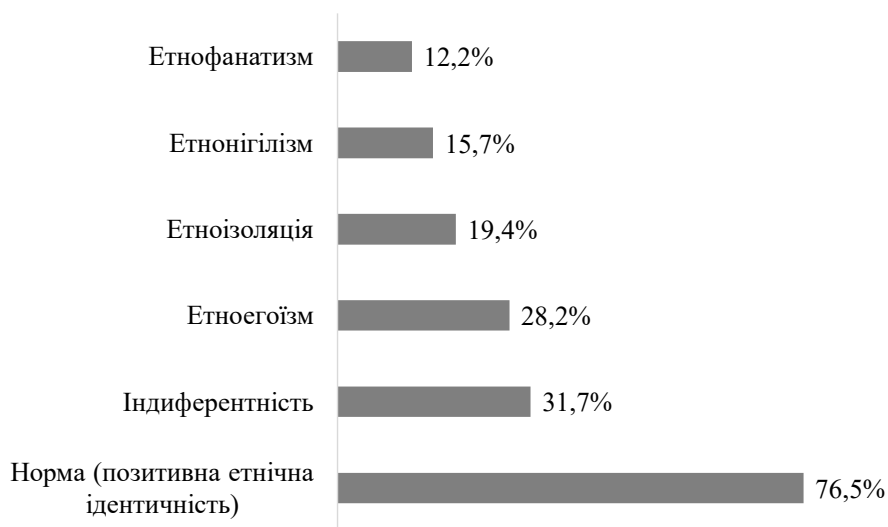
Рис. 3. Вираженість типів етнічної ідентичності