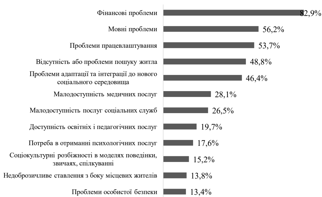
Рис. 1. Актуальні проблеми українських біженців в країнах ЄС (можна було обрати декілька варіантів)

На рис. 2 представлено оцінку рівня вираженості різних видів толерантності і загальний індекс толерантності українських біженців за кордоном. Більшість показників знаходяться на середньому рівні, майже третина опитаних (27,5%) виявили високий рівень етнічної толерантності, що вказує на позитивні тенденції щодо адаптації біженців до нового соціокуль-