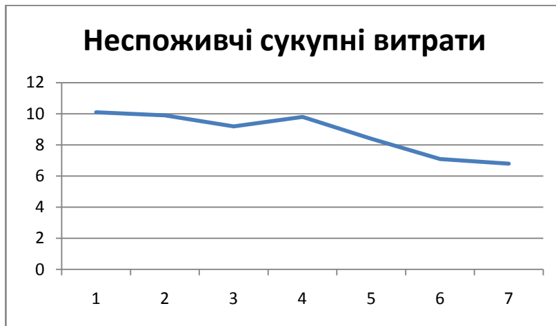
Рис. Д.2 Неспоживчі сукупні витрати