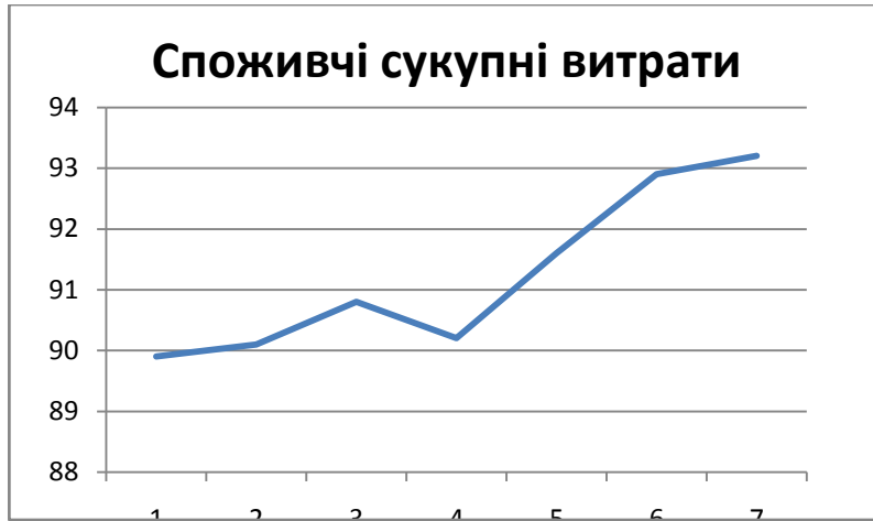
Рис.Д.1 Споживчі сукупні витрати