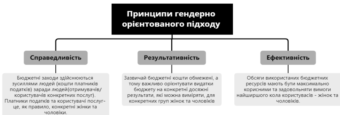
Рис. 2. Принципи гендерно орієнтованого підходу в бюджетному процесі

До принципів гендерно орієнтованого підходу належить справедливість, результативність та ефективність (рис 2) складено автором на основі [2, с.34].