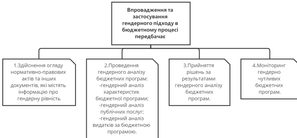
Рис. 3. Кроки впровадження та застосування гендерного підходу в бюджетному процесі

Відповідно до Методичних рекомендацій Міністерства фінансів України [13] впровадження та застосування гендерного підходу в бюджетному процесі передбачає чотири кроки, які наведено на рис. 3.