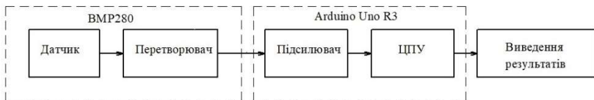
Рисунок 1 – Схема вимірювального ланцюга стану повітря у впускній системі двигуна

На кафедрі двигунів внутрішнього згорання НУ «Запорізька політехніка» розроблено методику дослідження стану повітря у впускній системі двигуна (див. рис. 1). В ході дослідження за допомогою мікроконтролера Arduino Uno R3 та датчика абсолютного тиску BMP280 були отримані показники тиску у впускному колекторі двигуна.