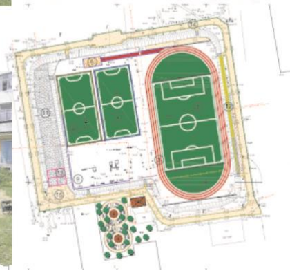
Рисунок А.4 – Приклади майданчиків