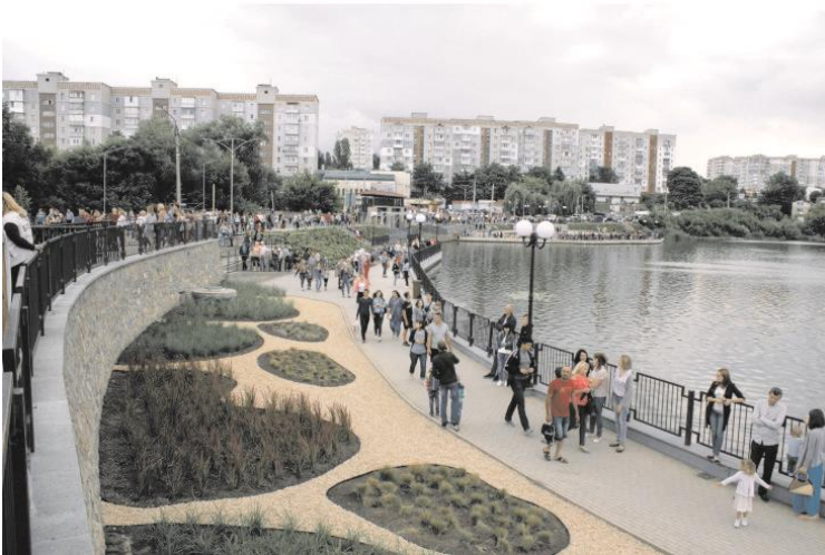
Рисунок А.2 – Фрагмент набережної