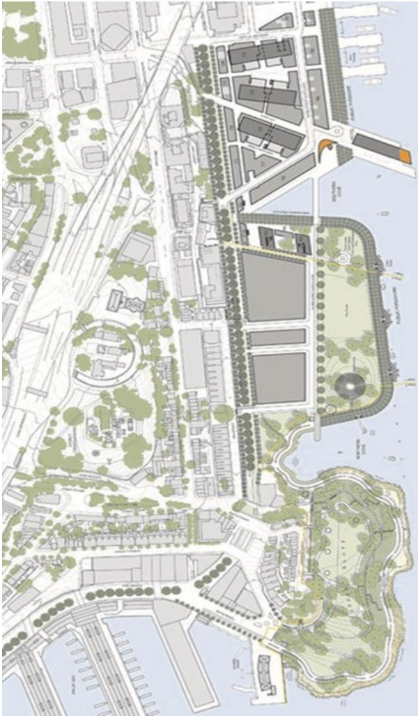
Рисунок А.1 – Фрагмент плану