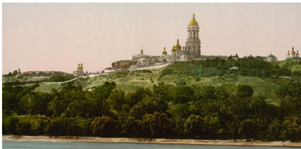
Рисунок 2 – Києво-Печерська лавра

Неможливо не виділити схожість місцезнаходження подібного комплексу у Львові – Собор Святого Юра. Вони обидва мають унікальні архітектурно-просторові та містобудівельні розміщення.